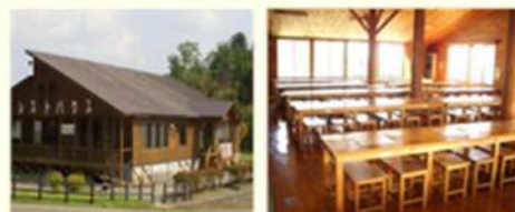
史跡尾去沢鉾山レストハウス 250名様ご利用可能 ログハウス調の建物

上記のお料理は250名様まで対応いたします。 ご予算に応じて調製いたしますのでお問合せ下さい。