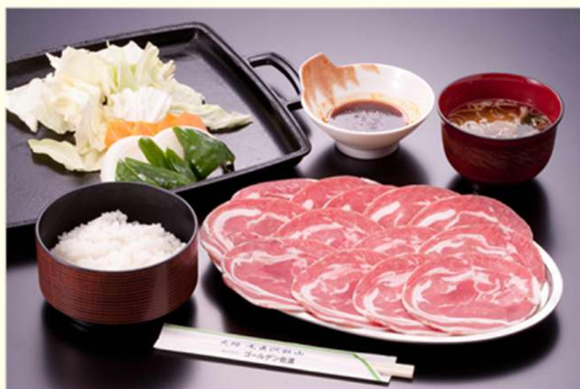
盛付けイメージ：ラム肉、野菜2人前